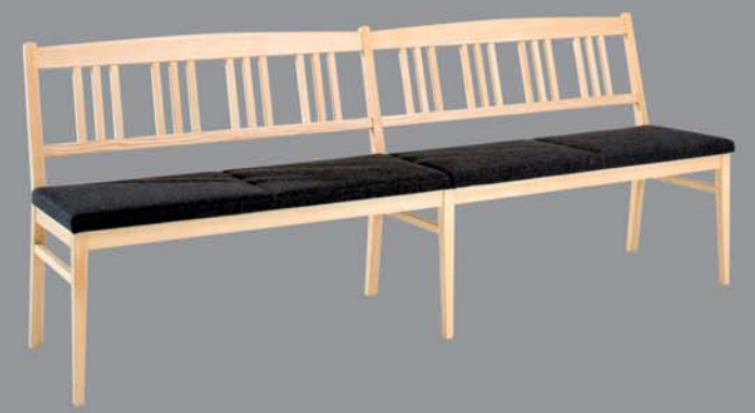
Sprossenbank LIGA Eiche, Nuss, Ahorn, Buche, Esche