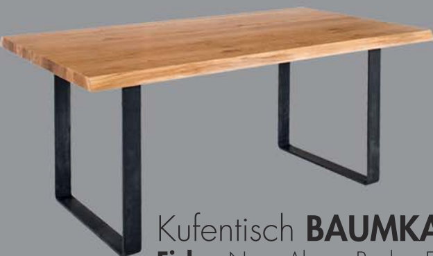
Kufentisch BAUMKANTE Eiche, Nuss, Ahorn, Buche, Esche