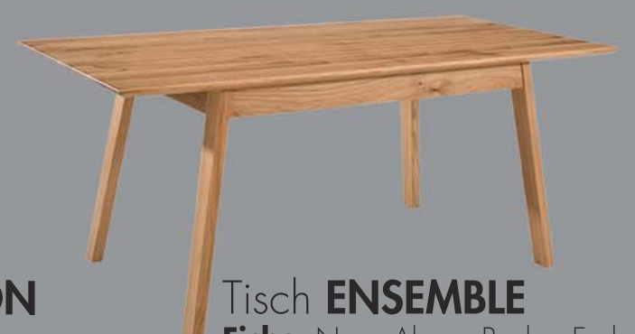
Tisch ENSEMBLE Eiche, Nuss, Ahorn, Buche, Esche