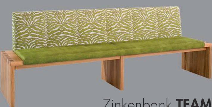
Zinkenbank TEAM Eiche, Nuss, Ahorn, Buche, Esche