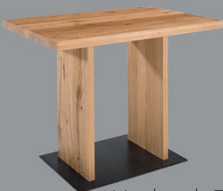
Hochtisch FORUM Eiche, Nuss, Ahorn, Buche, Esche