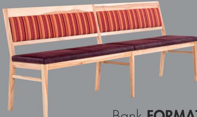
Bank FORMAT Eiche, Nuss, Ahorn, Buche, Esche