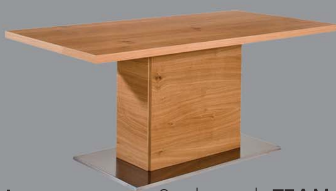
Säulentisch TEAM Eiche, Nuss, Ahorn, Buche, Esche