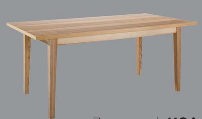
Zargentisch LIGA Eiche, Nuss, Ahorn, Buche, Esche