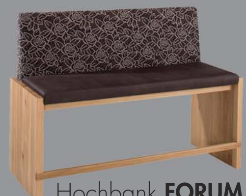
Hochbank FORUM Eiche, Nuss, Ahorn, Buche, Esche