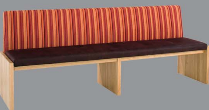
Wangenbank FORMATION Eiche, Nuss, Ahorn, Buche, Esche