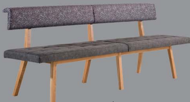
Bank ENSEMBLE Eiche, Nuss, Ahorn, Buche, Esche